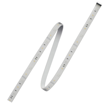
LIGHTIFY™ LED-list (36-5927) 499 kr.