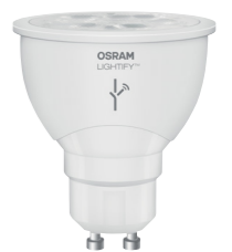
LIGHTIFY™ LED-lampa (36-5926) 399 kr.