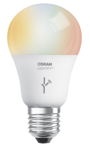
LIGHTIFY™ A60 LED-lampa (36-5925) 499 kr.