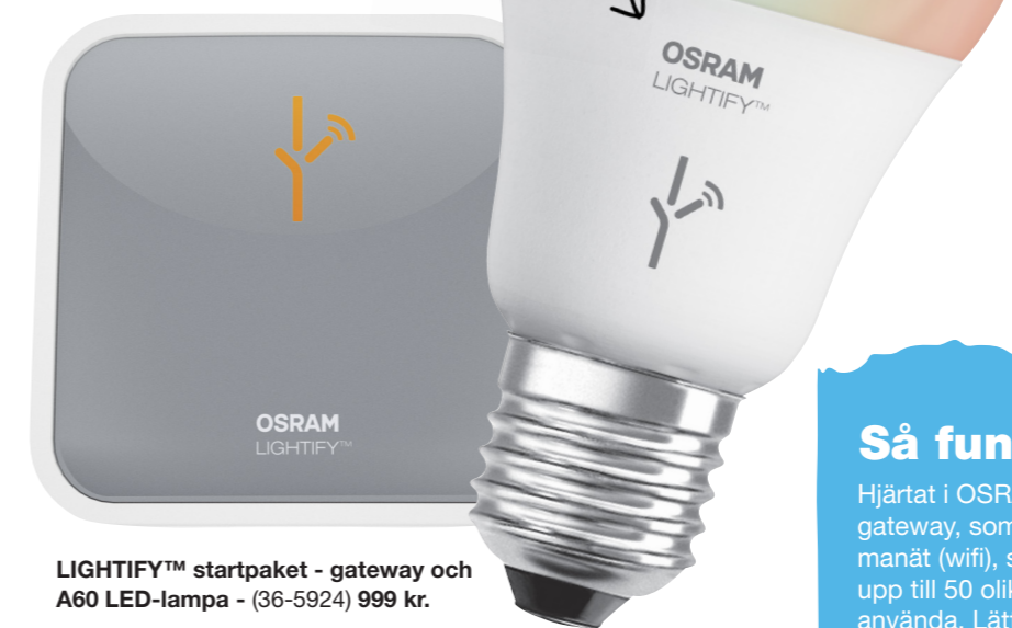
LIGHTIFY™ startpaket - gateway och A60 LED-lampa - (36-5924) 999 kr.

Installeras i vanliga lampsocklar - all teknik är inbyggd i LED-lampan!